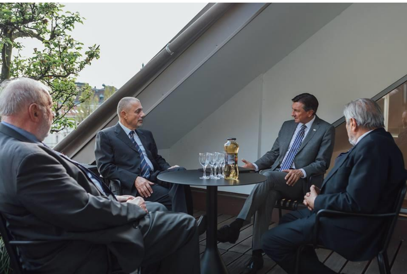
FOTO: Obisk predsednika ob izdaji novega Komentarja Ustave Republike Slovenije