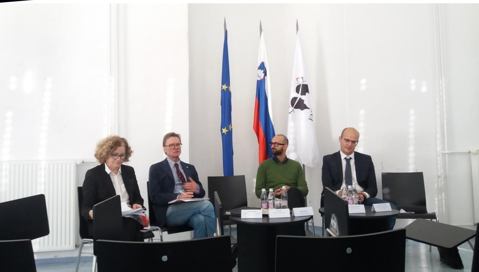
Foto: Deveta mednarodna konferenca o pravni teoriji in pravni argumentaciji